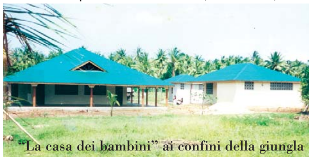
"La casa dei bambini" ai confini della giungla