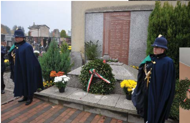
Sopra: Lapide dei caduti al cimitero A lato: Centro Civico di Villanova