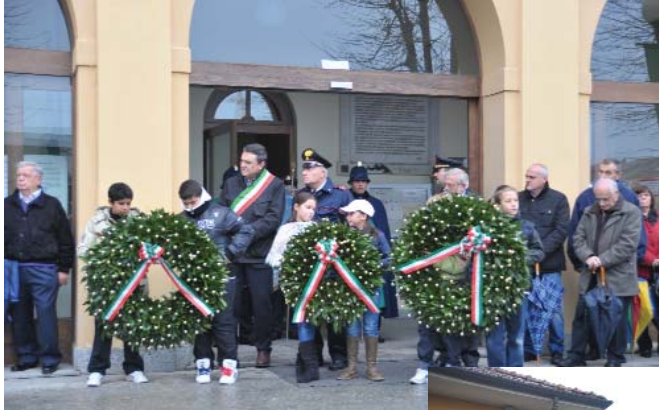
Sopra: Palazzo Laura Solera Mantegazza