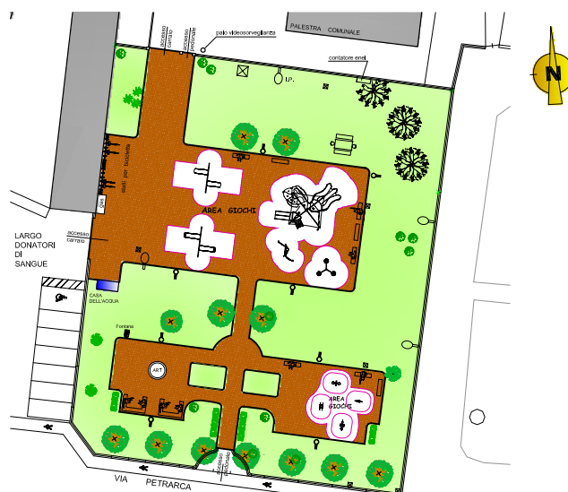
Progetto per il rinnovamento del parco giochi di largo Donatori del Sangue.

alla spina acqua filtrata sia nella forma naturale che gasata. Saranno inoltre risistemati gli accessi, uno dei quali direttamente dalla scuola.