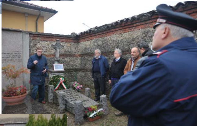
A lato: Tomba dell'Eroe Franzolino Prinetti