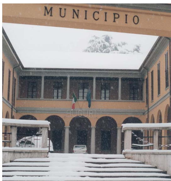
Palazzo Comunale 25 Dicembre 2000