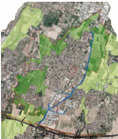
Amministrazione del P.L.G. Parco Agricolo Nord Est - in verde scuro Progetto Comune di Bernareggio

Prosegue la modifica all'attuale Piano di Governo del Territorio con l'obiettivo di inserire quasi il 40% del territorio nel Parco Agricolo Nord Est , ridurre ulteriormente il consumo di suolo , rivedere alcune norme tecniche